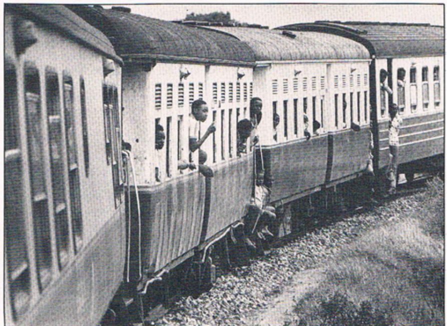
Een stipte trein... Soms staat er een olifant op de rails

De trein van Mombassa naar het Victoriameer rijdt nog steeds. De Duitse diesellokomotief vertrekt om zeven uur 's avonds. Dertien uur later, om acht uur 's morgens, rijdt hij Nairobi binnen. En 's avonds, om halfzes, rijdt hij verder naar Kisumu waar hij de dag erop 's morgens aankomt. Een stipte trein. "Giraffes zijn het gevaarlijkst", zegt de machinist, "ze komen 's nachts af op de lichten van de lokomotief, gaan wijdbeens over het spoor staan wachten. Soms staat een olifant op de rails. Maar, ze verliezen het van de trein". Het spoor is een goede