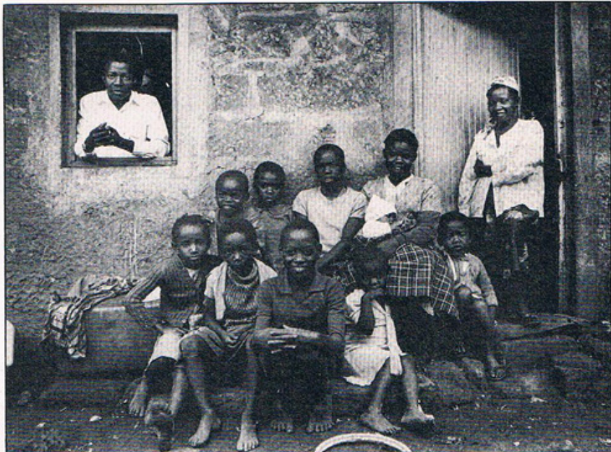
Twee grote problemen beheersen Kenya: de bevolkingsgroei, bijna de hoogste ter wereld, en de te lage voedselproductie

Twee grote problemen beheersen Kenya: de bevolkingsgroei, bijna de hoogste ter