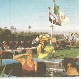
Rivieruise van Luxor naar Aswan.