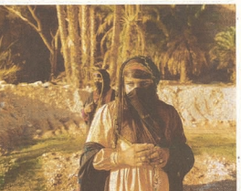
In de Sinai-woestijn.