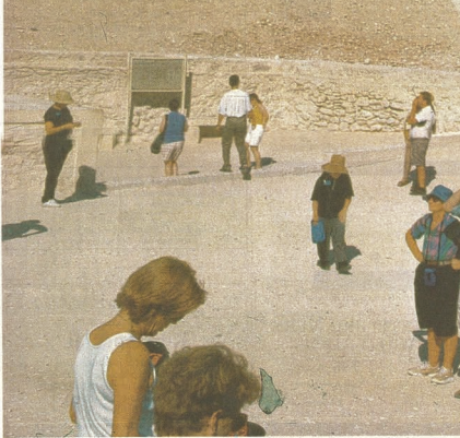
Koningsvallei bij Luxor.

Afritokke fietsend, laverend tussen de toeristenbussen en treterende taxi's. Ben ik op zoek naar het oude puntje? dat de lokale bevolging voor een paar dubbeltjes overzet naar de westerse van de Nijl. Maar de Corniche langs de rivier is de afgelopen vijftien jaar half onherkenbaar veranderd, volgebouwd met hotels, de kade afgeladen met luxe toeristenbussen.