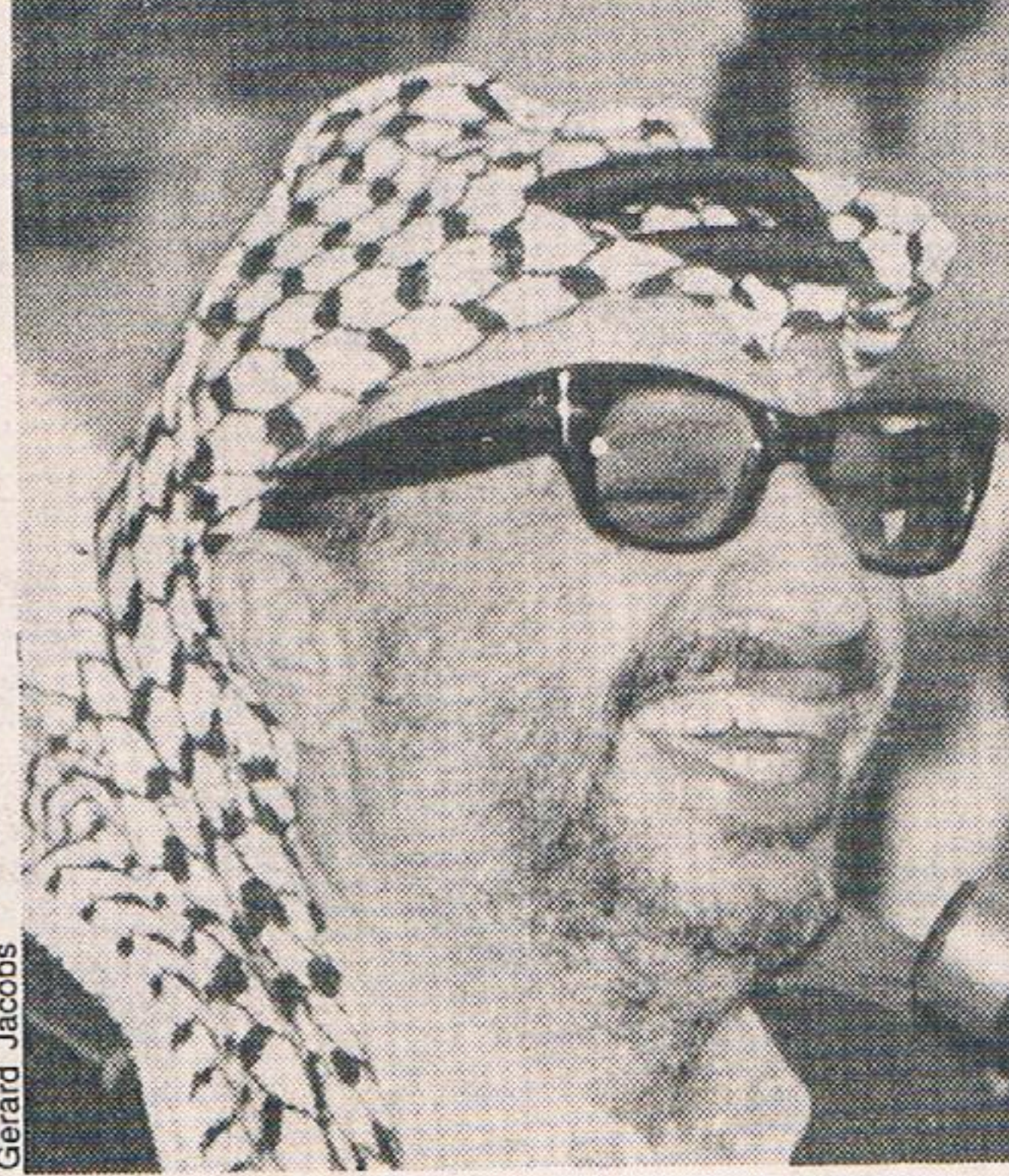
Jasser Arafat: olijftak nog in de hand