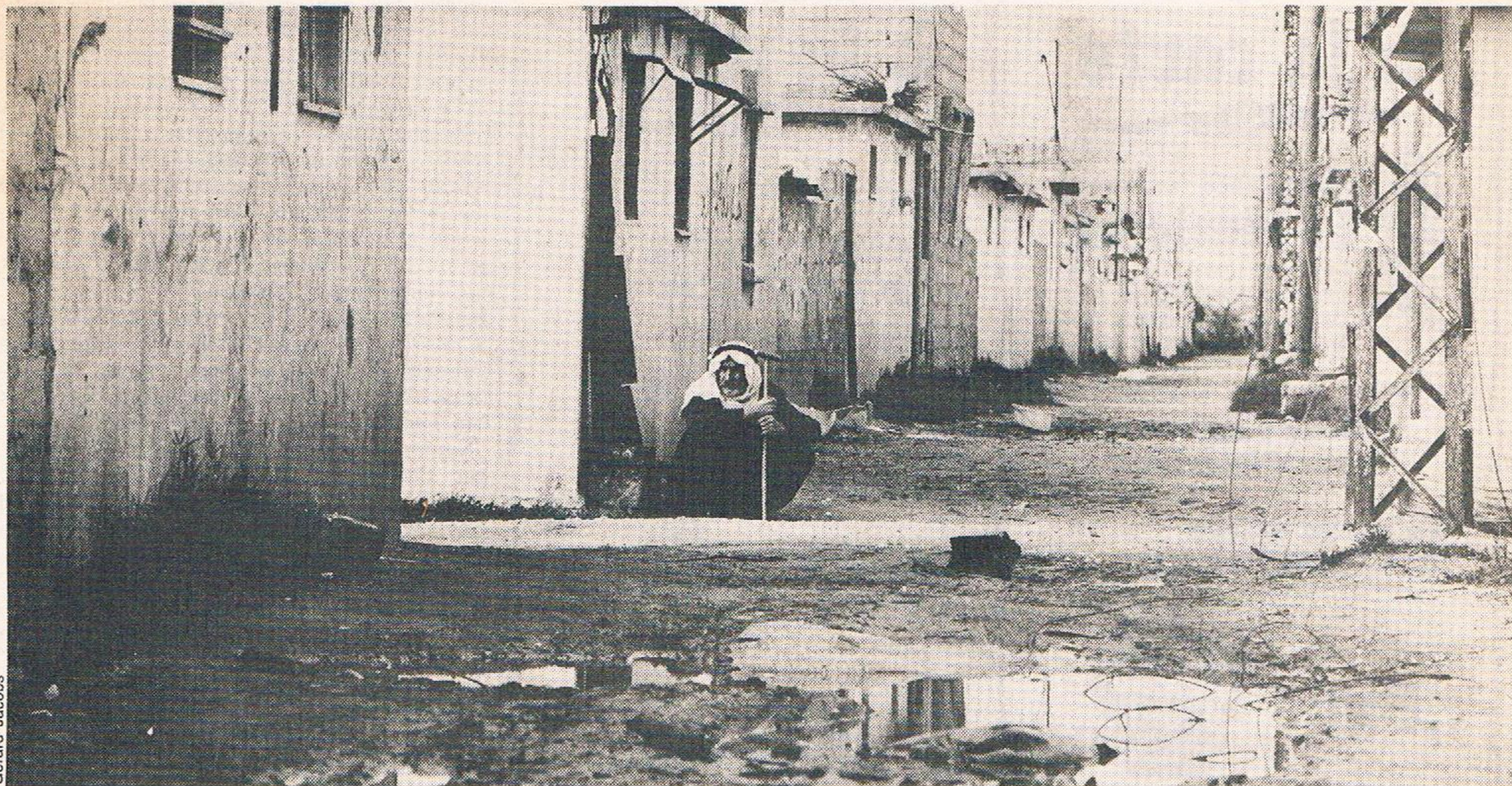
'Samengepakt in de kampen wachten ze gelaten af'

te keren naar zijn geboortegrond erkent en de grenzen van die staat omschrijft (westelijke Jordanoever en Gaza, red.), zonder van de PLO te eisen het doel, een democratische, non-sectarische staat in geheel Palestina op te geven." Deelname aan diplomatieke onderhandelingen 'op voet van gelijkheid met alle betrokken partijen' over een regeling van het Palestijnse probleem wordt geaccepteerd. „Het is afgelopen met de Palestijnse revolutie,” verklaart George Habash.