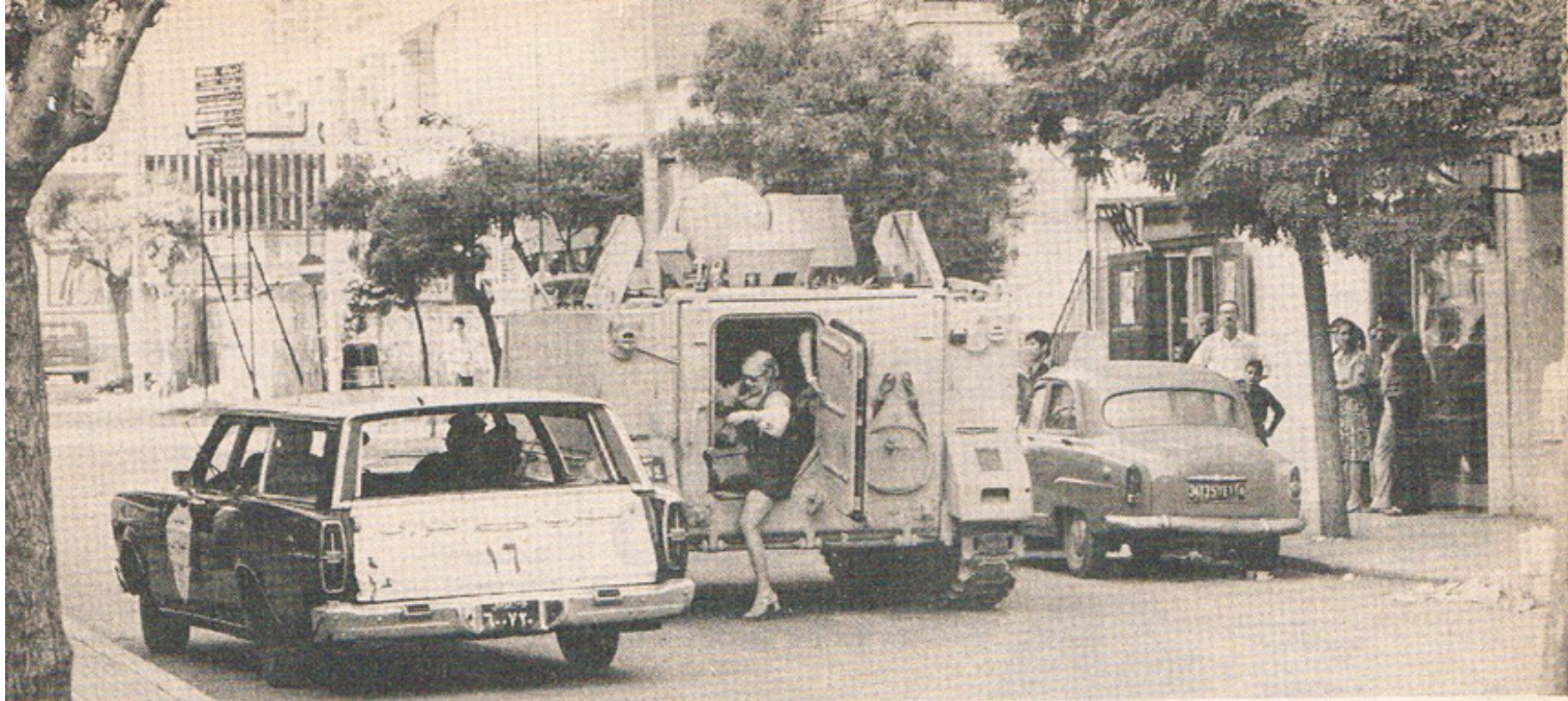
Pantserwagens evacueren de burgers

serie raketten slaat in. Wij kruipen bij elkaar op de gang. Van vrienden horen we dat de nasseristen de aanval hebben geopend op de grote hotels. Zij zijn vooral geïnteresseerd in het Holiday-Inn, dat barstensvol wapens voor de falangisten zou zitten.