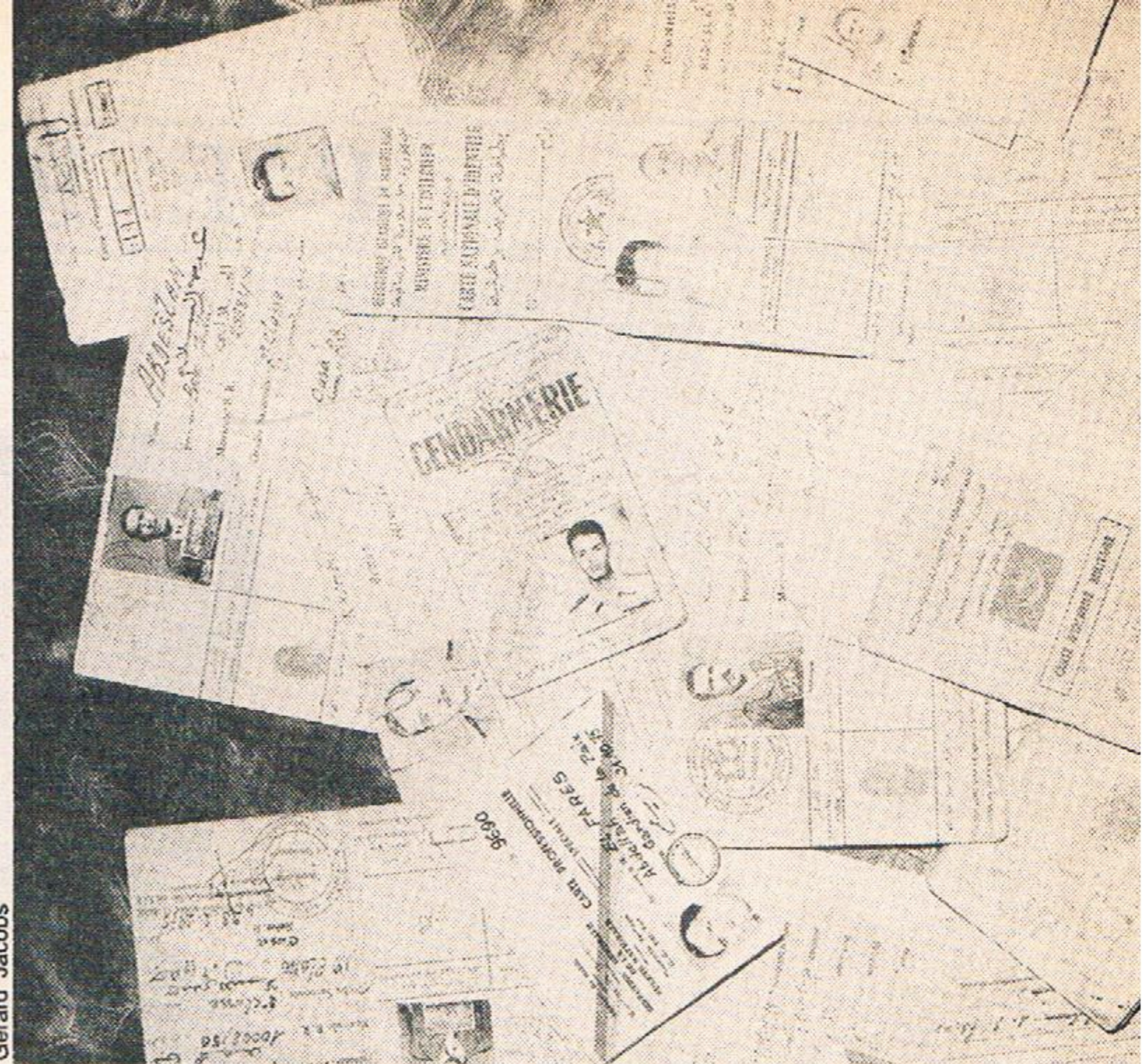
Door Polisario buitgemaakte vijandelijke identiteitskaarten: bewijsmateriaal

dat de koloniale grenzen gerespecteerd dienen te worden als de kolonisator vertrekt. Bovendien is het recht op zelfbeschikking van de Saharoui's al meer dan tien jaar geleden erkend en vastgelegd door de OAE en de verenigde Naties.