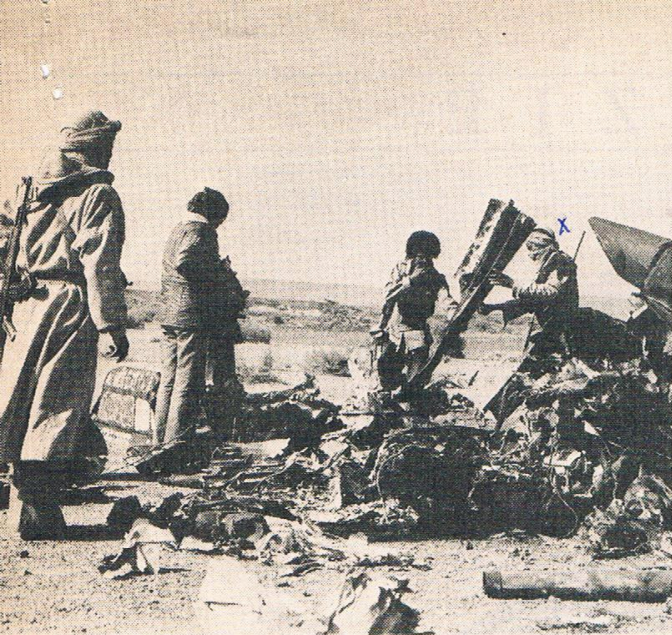
Guerrilla's bij het wrak van een Mauretaans vliegtuig: 14 dagen slag